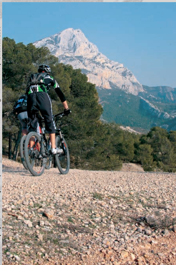
Réalisation : Direction de l'Environnement (DEN) Petit Fibras - Conception maquette : Michèle GIFFAUD DCL Petit Fibras - © Photo : J.P. Huetbaq - ÉMON Jun 2008

Difficulté : Difficile Distance : 7 km Dénivelé : 335 m Temps : 0H 50